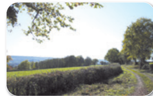
Aire de pique-nique du bois des chaumes