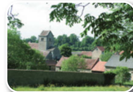
Vue sur Saint Gervais sur Couches

Saint Gervais sur Couches, son église romane et sa vue sur le mont Rème.