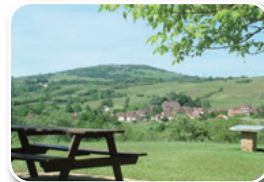
Vue Saint Maurice les Couches

Saint Maurice les Couches, Typique et pittoresque village vigneron entre coteaux et vallées, Saint-Maurice-les-Couches a été fondé par une charte capétienne en 1295 sur l'emplacement d'une chapelle romaine dédiée à Saint-Maurice.