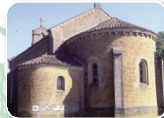
Eglise de Saint Maurice les Couches