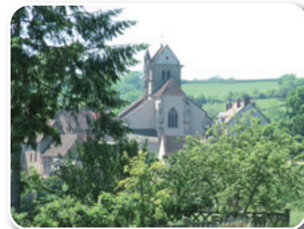
L'église de Couches