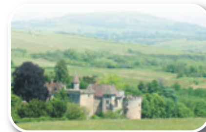
Le château de Couches