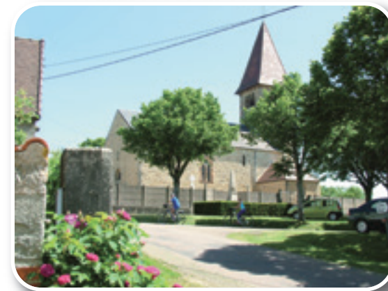
Eglise Saint Jean de Trézy