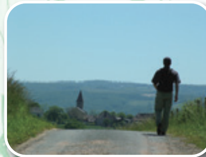
Saint Jean de Trézy