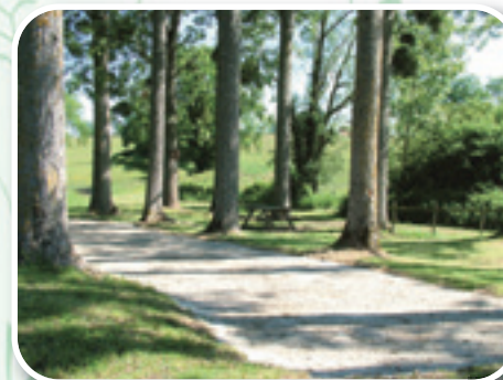
Sentier balades vertes

*Note : Aller-retour possible jusqu'au monument commémoratif en bordure de la D984, avec aire de pique-nique.