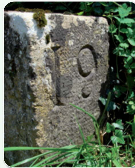
Borne des Bastients

Au départ place près de l'église (stationnement et panneau)