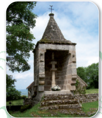
Oratoire du XVI e siècle