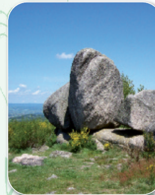
Les Rochers du Carnaval