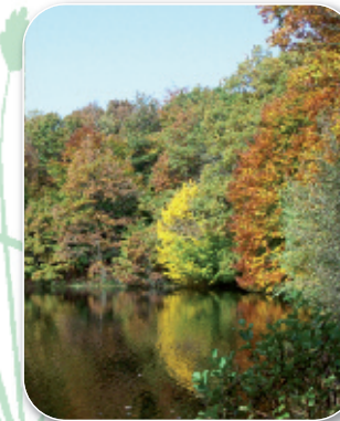
Etang du prieuré