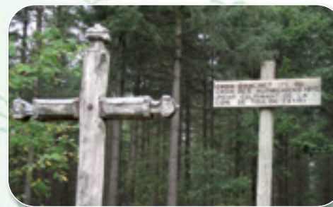
La Croix d'Ancint (point culminant de Toulon sur Arroux)