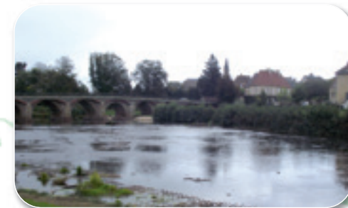
Le Pont du Diable