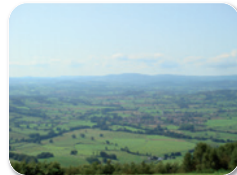
Point de vue depuis la table d'orientation