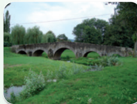
Pont de Mme De Sévigné

Le prieuré Saint Martin, fondé en 848, dont le prieur Pierre de Beaufort fut le dernier pape en Avignon sous le nom de Grégoire XI en 1370. L'église date du 12 ème siècle. Les ponts sont du 17 ème siècle, leur construction fut demandée par Madame de Sévigné.