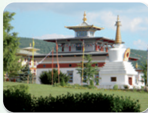
Le Temple des Milles Boudhas à La Boulaye