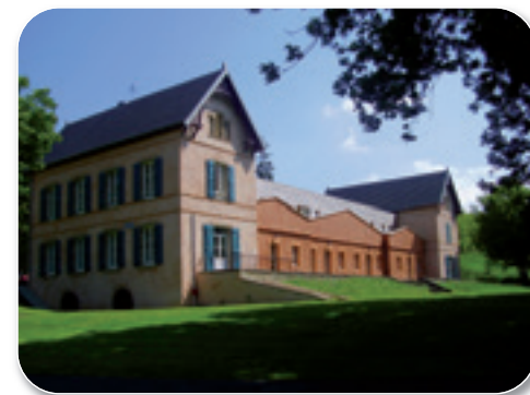
Château de La Boulaye (Hôtel)