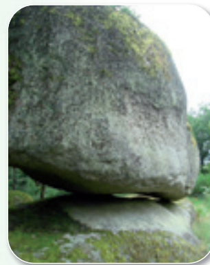
"La Pierre qui Croule"