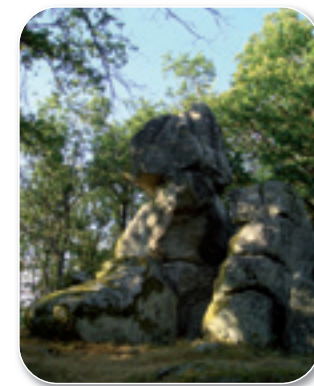
"Le Profil de Napoléon" ou "Bonnet du Diable"

DETTEY, Balcon du Morvan, mérite bien son appellation car nous avons ici l'un des plus beaux panoramas circulaire de la région. Au centre de ce petit village une petite église romane de la fin du 11 ème siècle abrite des statues anciennes. A 200 mètres du village deux énormes masses granitiques se dressent dans la forêt : "Le Profil de Napoléon" ou "Bonnet du Diable" et "La Pierre qui Croule" que l'on peut encore faire « crouler » si on la pousse au bon endroit !