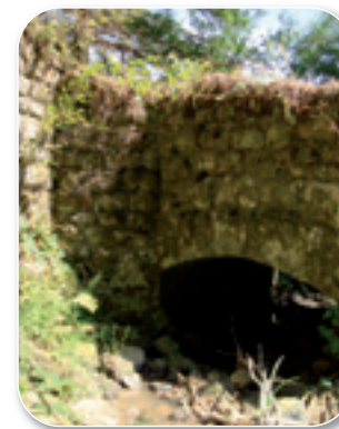
Le Pont de Valveron