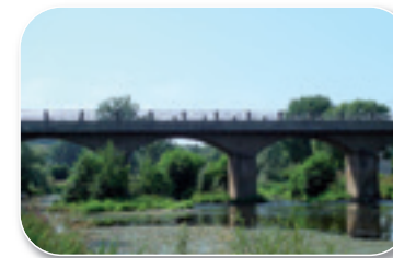
Pont sur l'Arroux