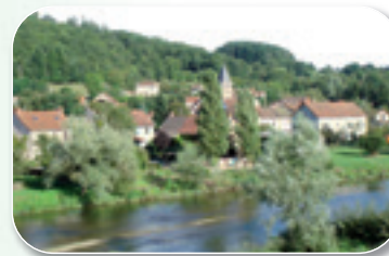
Village de Charbonnat

Charbonnat est traversé par l'Arroux. Le pont qui enjambe la rivière fut bâti pour remplacer un bac qui permettait la traversée de l'Arroux. Ce pont détruit pendant la Seconde Guerre mondiale, fut rebâti peu de temps après la fin de celle-ci.