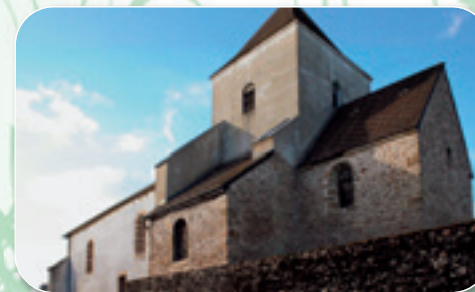
Eglise du 12 ème siècle