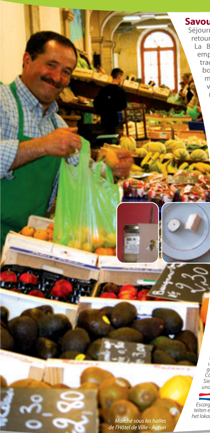
Marché sous les halles de l'Hôtel de Ville - Autun