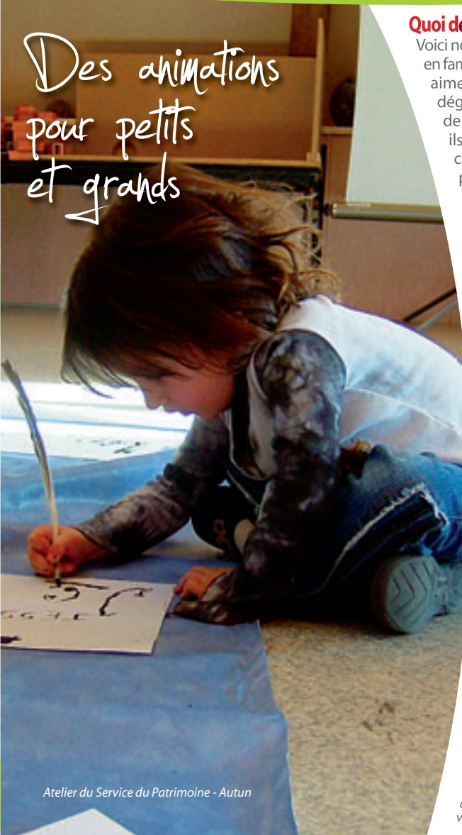
Atelier du Service du Patrimoine - Autun