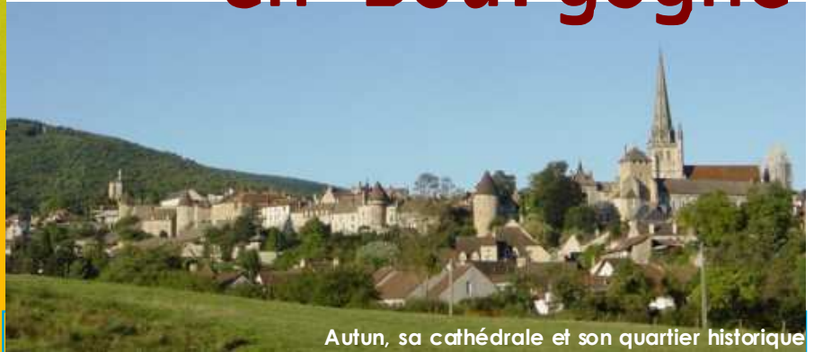
Autun, sa cathédrale et son quartier historique

Contact presse Delphine M ARTIN promotion@autun-tourisme.com Tél. : 03.85.86.80.83